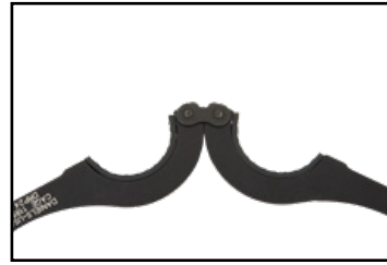
180 Degree Hinge

The DRP-XX circular ring pliers are specifically designed to grip circular connector and backshell components which would be deformed by other gripping methods. The nonmarring rubber jaw lining material is available in strip form and may be used to replace worn jaw inserts.